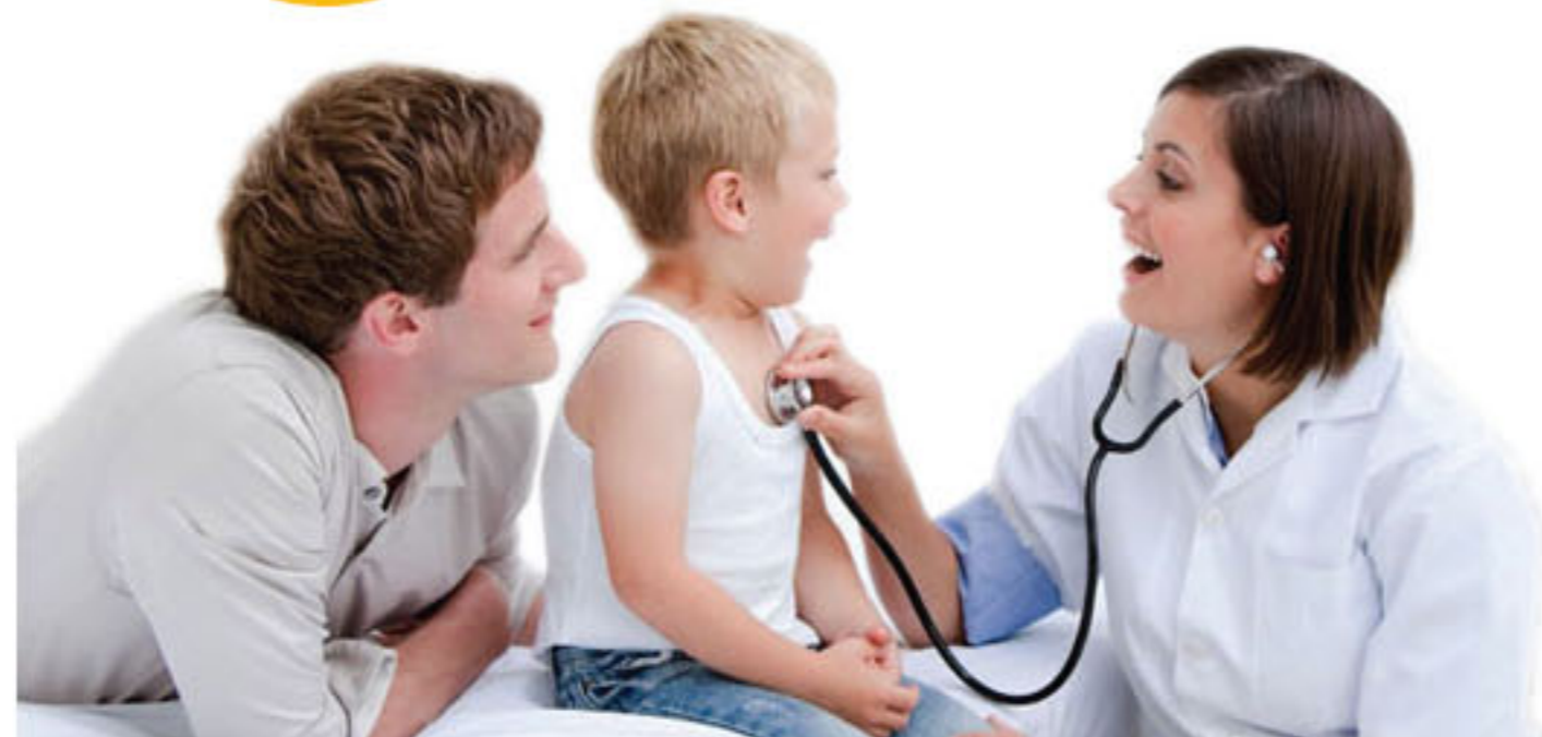
Los chicos siempre primero.